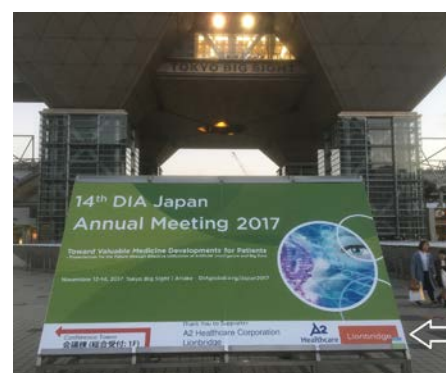
(右)東京ビッグサイト入口の案内板 ※写真は昨年のイメージです。