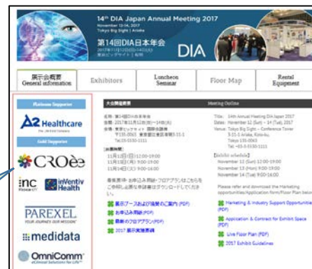
※昨年のイメージです