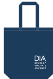
※写真はイメージです。(コンgresバッグ)